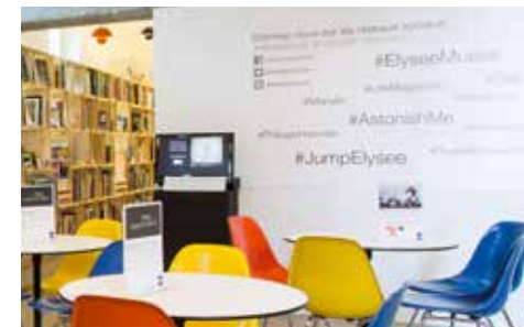
Mur de hashtags

L'année 2014 marque aussi le début d'un long chantier de refonte du site elysee.ch . Le premier semestre a été consacré à l'aspect User Experience, soit l'ergonomie du site. Divers sondages et ateliers ont été menés avec l'aide de l'agence web lausannoise :ratio, spécialiste de l'architecture et l'ergonomie des interfaces digitales. Le second semestre a été consacré à la réorganisation des contenus et la création du graphisme du site, toujours en lien avec les directives et recommandations de :ratio. Courant octobre, le nouveau graphisme a été livré à la DSI (Direction des systèmes d'information) pour l'intégration dans Typo3.