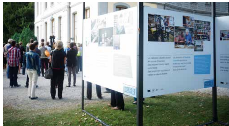
Inauguration de Passerelle culturelle