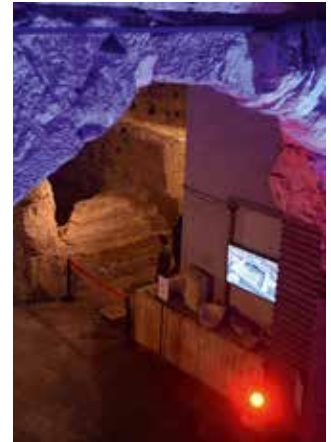
Événement Parmigiani Fleurier « The Chronicles of Time », vue de l'exposition de Giacomo Costa à Rome

Plusieurs collaborateurs ont représenté le musée, défendu ses intérêts et noué de nouveaux contacts en vue de futures collaborations à Paris Photo et au salon Off Print, où le musée tenait également un stand pour promouvoir ses publications.