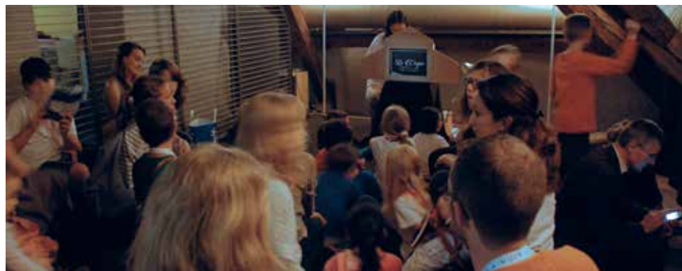
Théâtre d'images selon la technique de narration japonaise «kamishibai»

La recherche a révélé que le public perçoit le musée comme une institution culturelle dynamique et diversifiée à résonance locale et internationale en fonction des expositions proposées. Selon cette enquête, les visiteurs sont globalement satisfaits de la programmation ainsi que des prestations du musée.