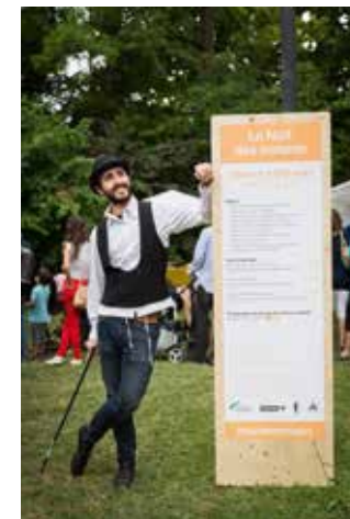
Nuit des images

Pour la Nuit des images, la signalétique extérieure a entièrement été repensée en accord avec l'identité graphique de l'événement, permettant ainsi aux visiteurs de mieux s'orienter (panneaux en bois qui s'intègrent dans le cadre et l'esthétique du musée, ballons lumineux, etc.). Des badges et des t-shirts ont été conçus pour les membres de l'équipe et les bénévoles. Afin d'apporter un regard neuf sur la manifestation, une carte blanche a été donnée au réalisateur Laurent Perreau pour la réalisation d'un film de présentation.