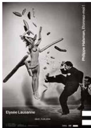
Affiche de l'exposition Philippe Halsman, Etonnez-moi !

Le Musée de l'Elysée présente la première étude consacrée à l'ensemble de son œuvre avec une sélection de plus de 300 pièces. L'exposition, organisée par Sam Stourdzé et Anne Lacoste, assistés de Lydia Dörner et Camille Avellan, a été vue par 26 870 visiteurs pour 90 jours d'accrochage, soit 299 visiteurs par jour.