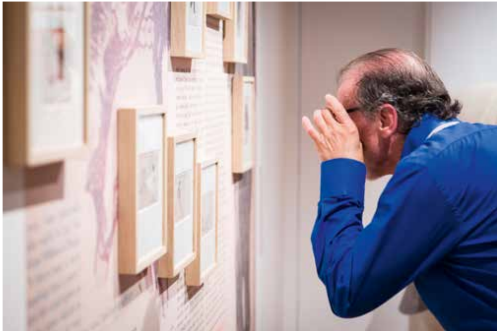
Exposition Chaplin, entre guerres et paix (1914 - 1940)