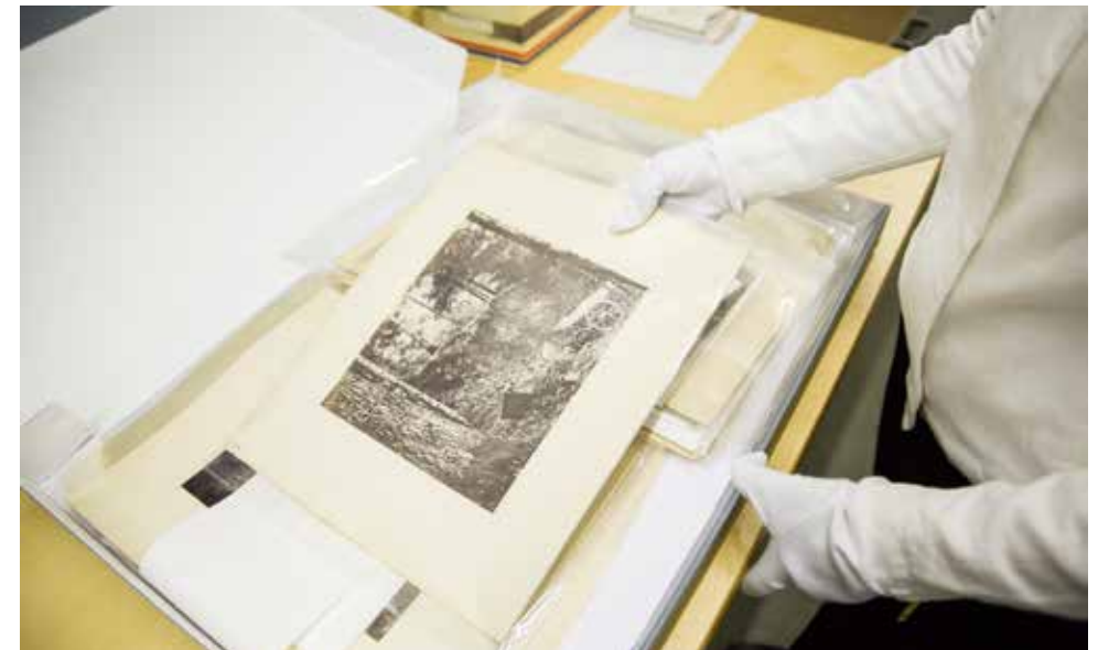
Collections du Musée de l'Elysée © Reto Duriet

Au mois de mars 2014, le déménagement de la plus grande partie des tirages grand format des collections, ainsi que des photographies montées ou encadrées a eu lieu. Cela a permis de désengorger les espaces dédiés aux collections dans le musée. Le dépôt de Corbeyrier accueille ainsi 350 œuvres couleur et noir et blanc, pour la plupart contemporaines.