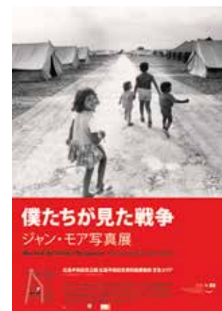
Affiche de l'exposition Jean Mohr au Japon