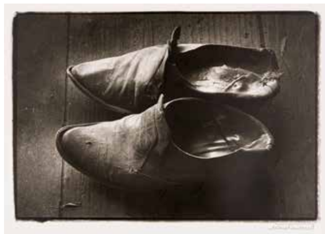
Marcel Imsand, Sans titre , Marcel Imsand © Musée de l'Elysée, Lausanne/courtesy Valérie Kessler