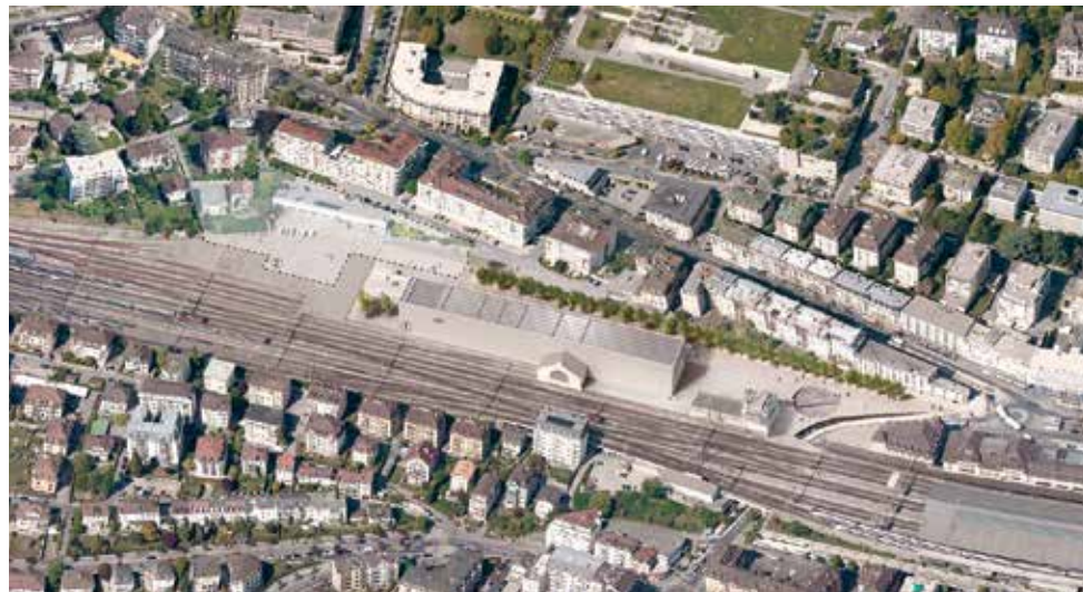
Vue aérienne