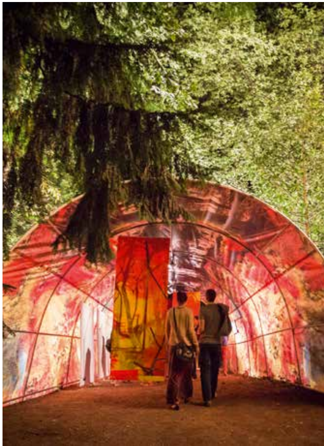
Nuit des images