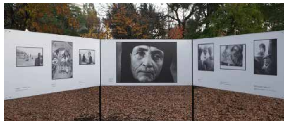
Vue de l'exposition Jean Mohr, Peace Park, Hiroshima

Hongrie Open Society Archives, Budapest 11.10.2014 – 12.01.2015 University of Pécs, Pécs 19.05.2014 – 24.06.2014 University of Szeged, Szeged 24.09.2014 – 10.10.2014