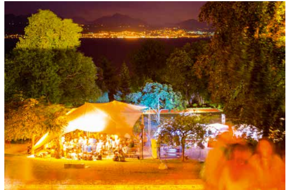
Nuit des images