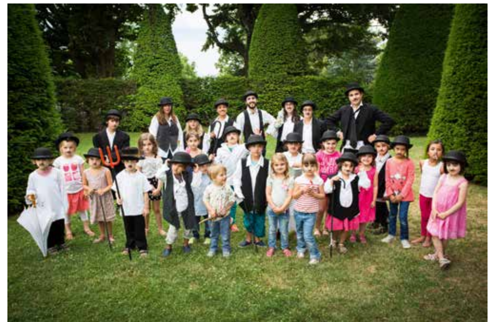
Nuit des images