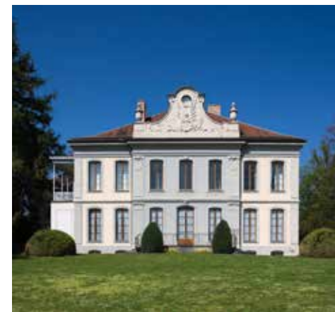
Musée de l'Elysée

L'activité éditoriale n'est pas en reste avec six publications en 2014 ( Philippe Halsman, Etonnez-moi! , Luc Chessex, CCCC, Luc Chessex, Cherchez la femme, Matthieu Gafsou, Only God Can Judge Me, Tediousphilia, Charlie Chaplin, L'Album Keystone, l'invention de Charlot ) et la sortie des numéros 7 et 8 du magazine ELSE .