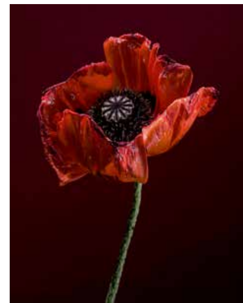
Luc Chessex, Matanzas , 1962 Matthieu Gafsou, Papaver somniferum , 2013