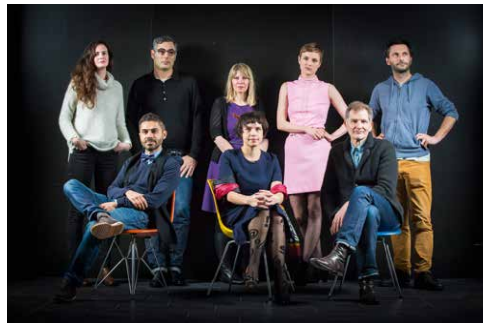
Les huit nominés du Prix Elysée