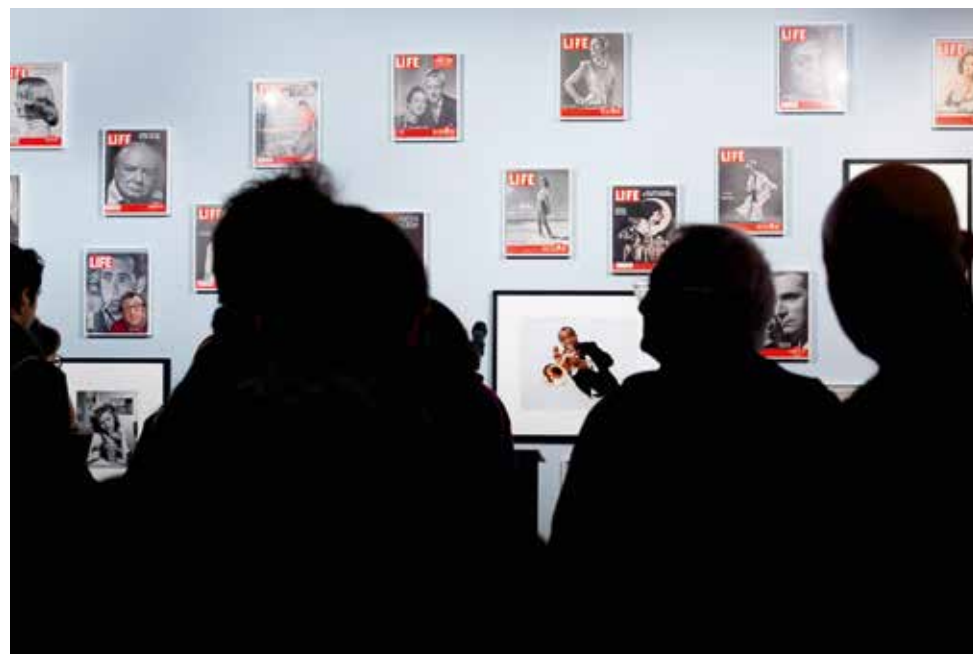
Exposition Philippe Halsman, Etonnez-moi !