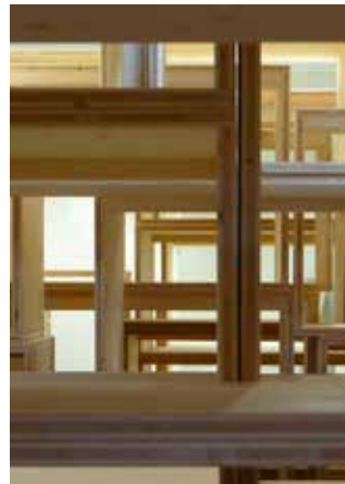
Travaux dans la bibliothèque

La régie des œuvres contrôle et tient à jour tous les mouvements des photographies au sein du musée: entrée des œuvres pour expositions, achats, dons ou dépôts, sortie des œuvres pour expositions, prêts et demandes diverses. Chaque œuvre est accompagnée d'un constat d'état qui répertorie toutes ses données (état général de l'objet, dommages éventuels, statut et renseignements divers) à l'arrivée et à la sortie du musée. Les photographes, les prêteurs et les emprunteurs en sont informés. La régie s'occupe aussi des assurances et du suivi des documents douaniers. La régie des œuvres est indispensable et garantit un suivi optimal de tous les échanges.