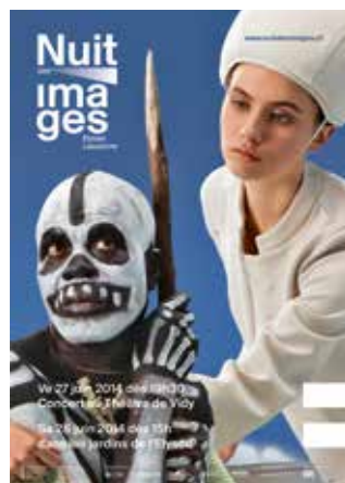
Affiche de la Nuit des images

Dès 15h, le salon du livre On Print, qui réunit des éditeurs et des ateliers de graphistes de la scène montante suisse, a rencontré une belle affluence avec la participation de 21 éditeurs de Suisse