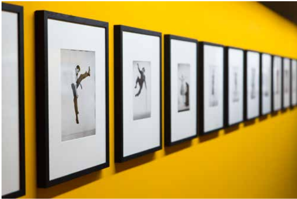
Exposition Philippe Halsman, Etonnez-moi! © Reto Duriel