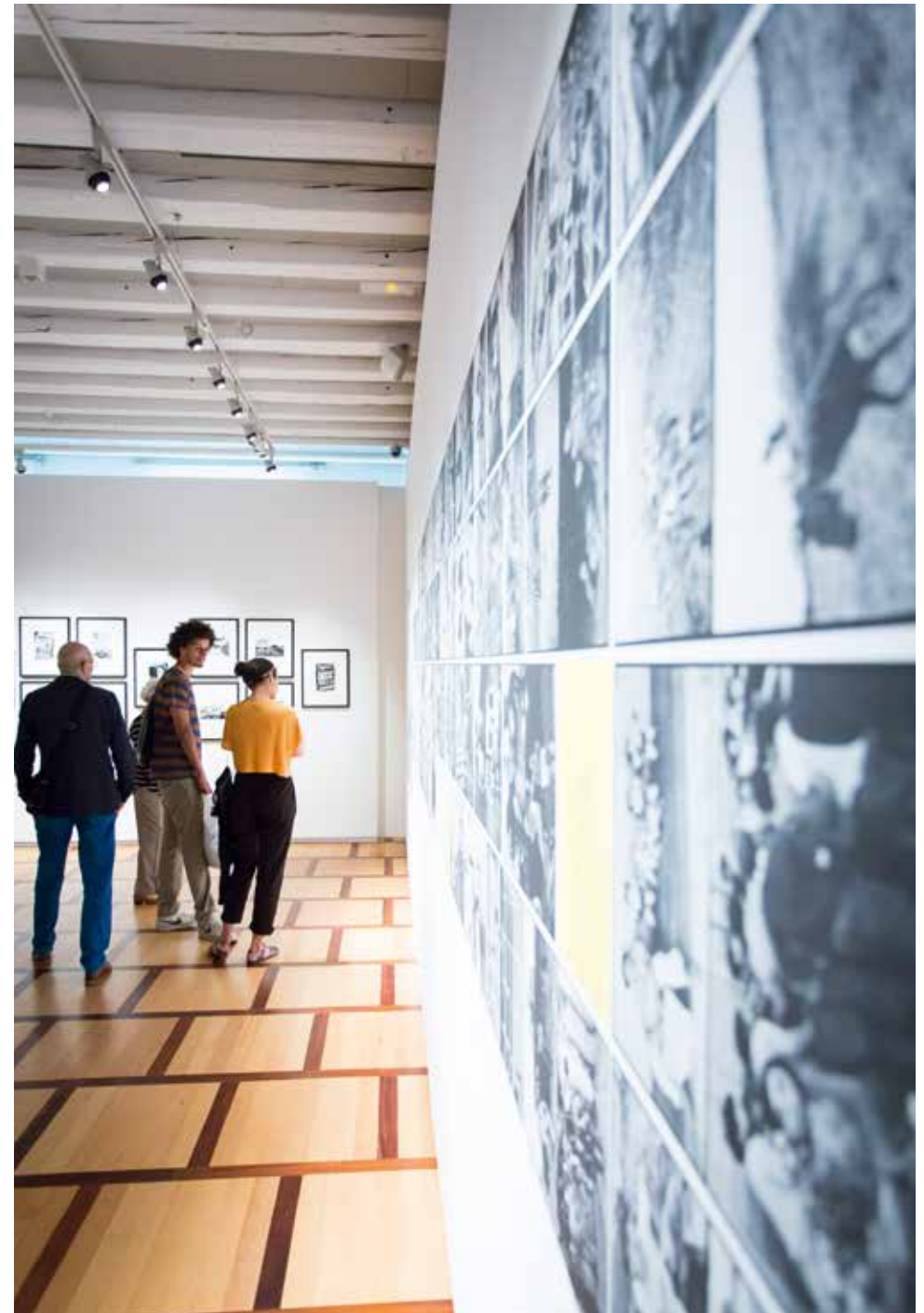
Exposition Luc Chessex, CCCC