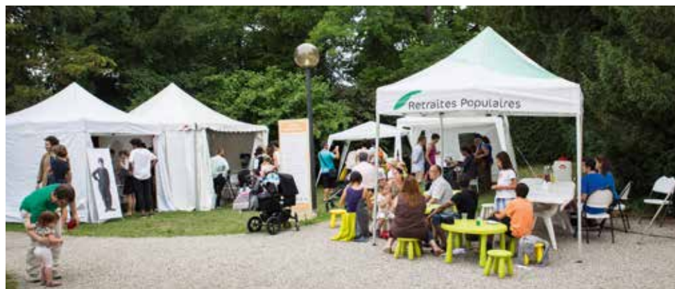
Nuit des images

En 2014, la banque privée PKB renouvelle son partenariat en soutenant une exposition par an et en publiant une annonce dans chaque édition du magazine ELSE (de 2015 à 2017). En 2014, dans une optique de valorisation des fonds du musée, PKB publie également une brochure de 12 photographies du Fonds Jules Jacot Guillarmod à l'attention de ses meilleurs clients.