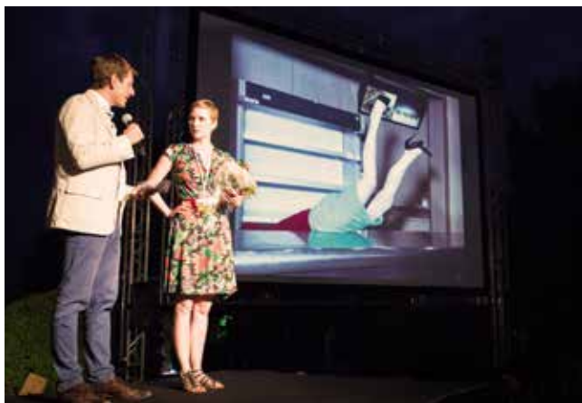
Nuit des images