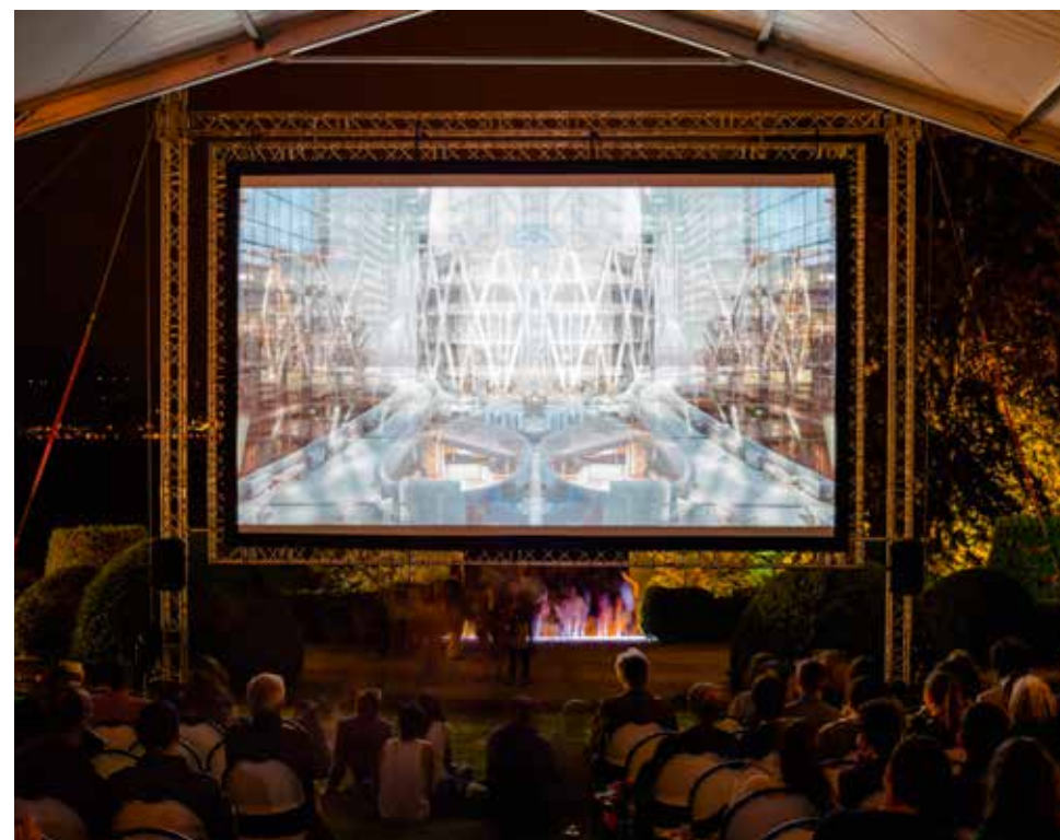
Nuit des images

romande et alémanique : a/b Books , art&fiction , abstract , Editions Circuit , davel 14 éditions , Hakuin Verlag , Editions de l'ECAL , Happy Birthday , Editions HEAD , LASSO , IDPURE , Le Dévaloir , le Magazine de Vidy , Novembre , NEAR , Ripopée , Ultraéditions , Sérendipité , YET magazine , et la librairie du Musée de l'Elysée. Un éditeur français, RVB Books, a pour la première fois été invité à participer et une table ronde intitulée «Les éditeurs font leur show» a été animée par Florence Grivel, journaliste à la RTS, pour donner la parole aux éditeurs.