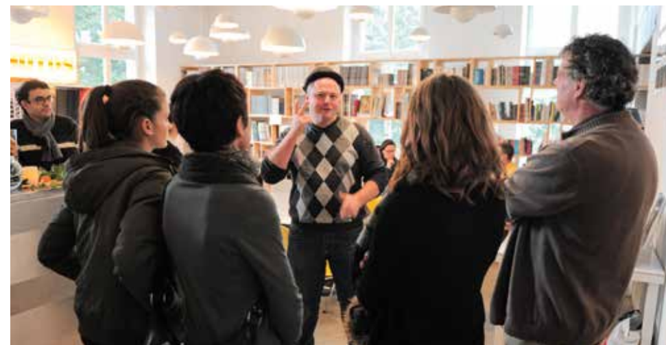
Café des signes