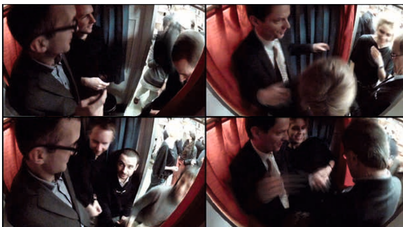
Vidéo réalisée à l'intérieur du photomaton lors du vernissage de l'exposition Derrière le rideau , L'Esthétique Photomaton