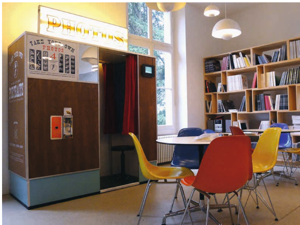
Photomaton dans le Café Elise