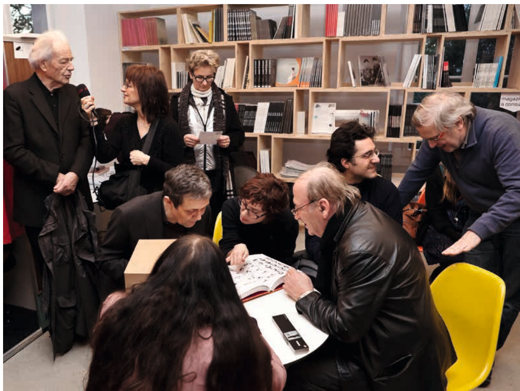
Haut et page de droite : Vernissage de l'exposition Derrière le rideau, L'Esthétique Photomaton