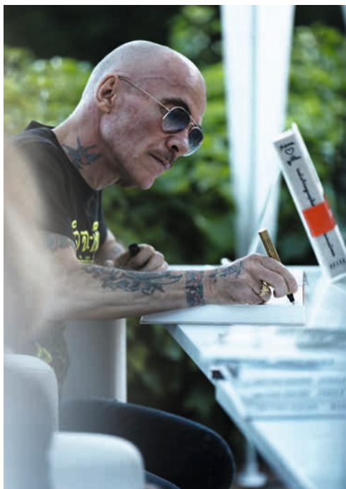
Bas: Signature du livre de Pierre et Gilles pendant la Nuit des images 2012