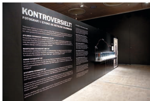
Exposition Controverses