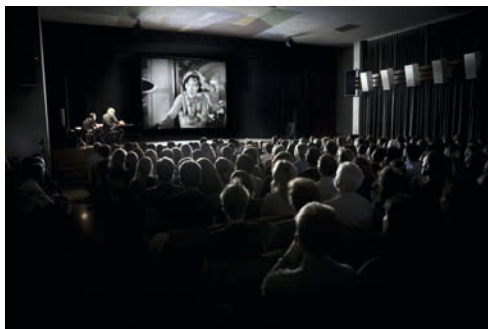
Page de gauche : Nuit des images 2012

Soixante-neuf photographes ont présenté leur travail en 2012 aux conservateurs du musée et 16 ont pu faire découvrir leurs œuvres au grand public lors de deux projections qui se sont déroulées le 9 mars et le 5 octobre.