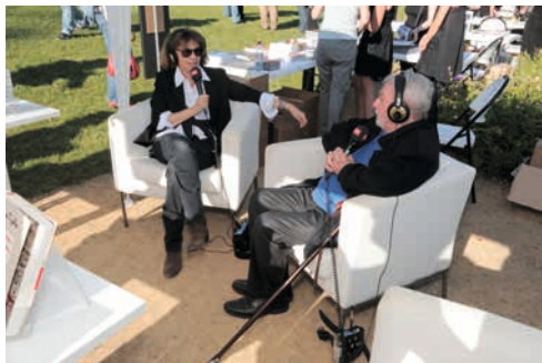
Nuit des images 2012