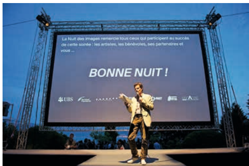
Nuit des images 2012