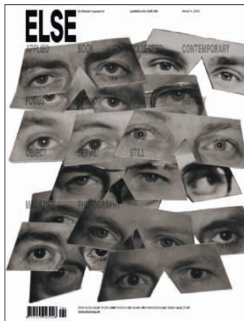
Couverture du quatrième numéro d'ELSE

Publié à 7'500 exemplaires, le magazine est distribué dans les librairies et les kiosques en Suisse et à l'étranger. Il est également disponible sur abonnement.