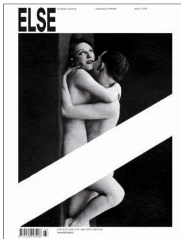
Couverture du troisième numéro d'ELSE