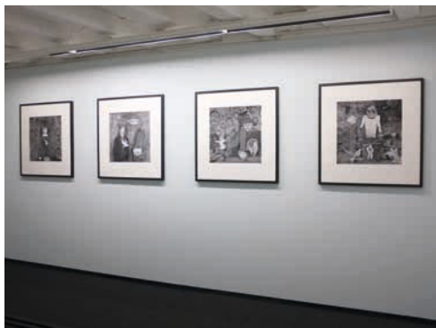
Exposition Roger Ballen, Asylum