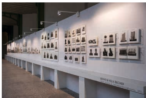
Exposition Bernd & Hilla Becher, Imprimés 1964-2012