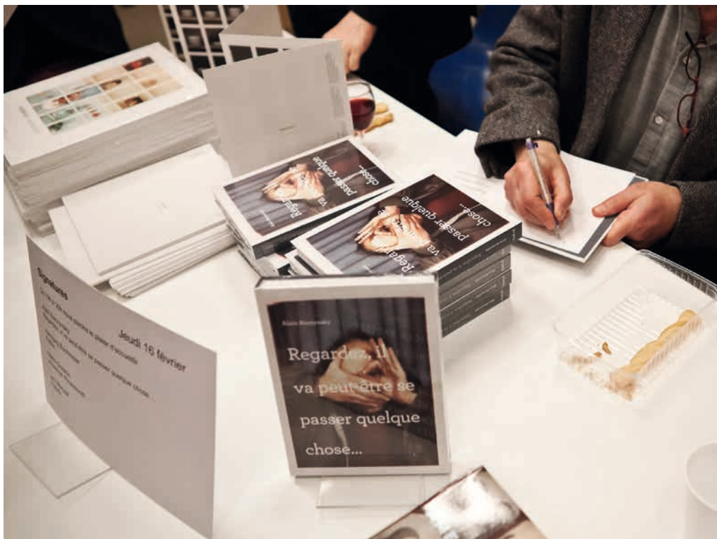
Signature pendant le vernissage de l'exposition Derrière le rideau, L'Esthétique Photomaton