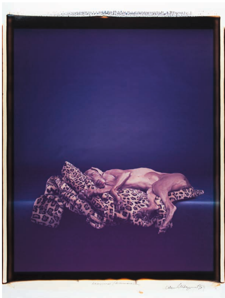
William Wegman, Leopard / Weimaraner , 1989 © William Wegman