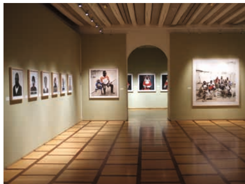
Exposition Pieter Hugo, This Must Be the Place

Par-delà son dispositif, le photomaton offre aussi l'occasion d'une interrogation profonde sur sa propre identité, sur celle d'autrui ou du groupe social auquel on appartient. A travers une soixantaine d'artistes et plus de 600 œuvres, c'est cette esthétique du photomaton, devenu genre artistique à part entière, que la présente exposition se propose de raconter.