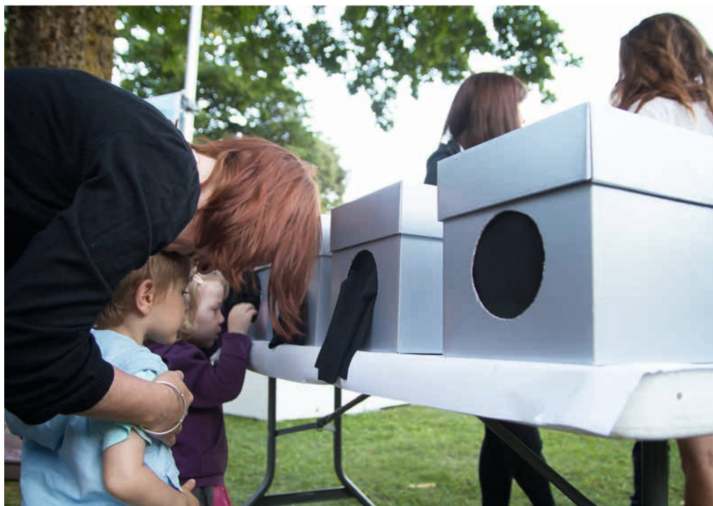
Haut: Nuit des images 2012