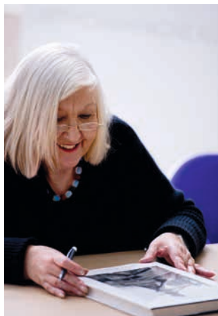
Hilla Becher © Paris Photo