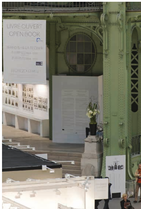
Exposition Bernd & Hilla Becher, Imprimés 1964-2012