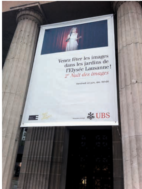
Annonce de la Nuit des images, UBS, Place St François, Lausanne

A partir de 2012, et pour trois années consécutives, UBS SA s'engage auprès du musée et devient le partenaire principal de la Nuit des images, pour un montant total de CHF 130'000.- (hors TVA). En prélude à la Nuit des images, le musée a organisé une exposition en avant-première dans le hall de l'agence UBS de la place Saint-François, à Lausanne, mis à disposition pour l'occasion. L'exposition 8 ½ de Fellini y a été présentée en 2012.