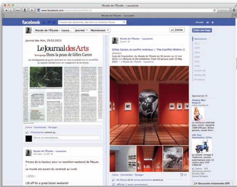
Page Facebook du Musée de l'Elysée