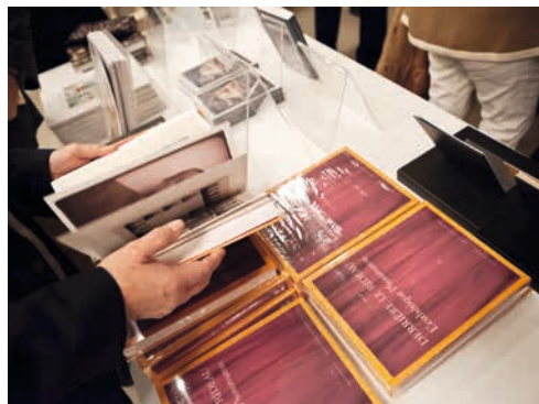
Livres Derrière le rideau, L'Esthétique Photomaton

of photography , Daniel Girardin, Christian Pirker, Actes Sud / Musée de l'Elysée, 2012, 28,4 x 22,4 cm, 312 pages, CHF 72.–