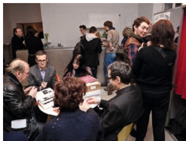
Vernissage de l'exposition Derrière le rideau, L'Esthétique Photomaton

Présentation par le Musée de l'Elysée de l'exposition Bernd & Hilla Becher, Imprimés 1964-2012 et du 4 e numéro de ELSE à Paris Photo.