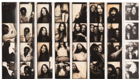
Photoboosths Images of William Eggleston's Circle of Friends © William Eggleston