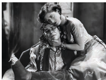
Extrait du film The Unknown © Tod Browning